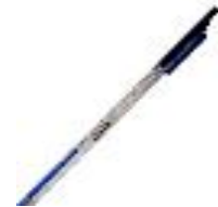
201 T DHS

Digitale pH-elektrode met DHS-technologie. Temperatuursensor geïntegreerd. Kunststof behuizing voor algemeen gebruik. Onderhoudsvrij. pH: 0 ... 14 - T: 0 ... 60 °C Artikel: 32200103