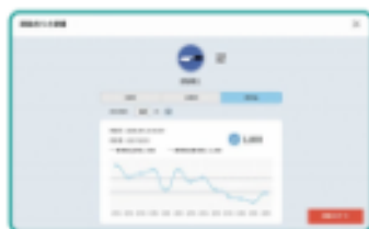
Toon tijd-seriegegevens voor elke inspectie

De geregistreerde gegevens kunnen in een tijdserie worden getoond middels registratie met onze gespecialiseerde app. De inspectiepasseraties worden automatisch in een diagram vastgelegd, en verbeteringen zijn te bekijken. Werknemers zullen zich beter van hygiëne bewust worden, en zullen een hoge hygiënorm op hun werkplek aanhouden, waardoor u in uw zaak meer vertrouwen kunt opbouwen.