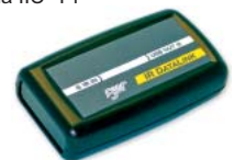
IR DATALINK USB ADAPTER